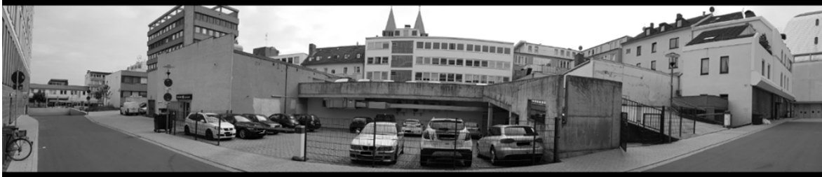
Abb. 1: Eigene Aufnahmen vom Plangebiet (Panorama, Grundstückszufahrt, Parkdeck)