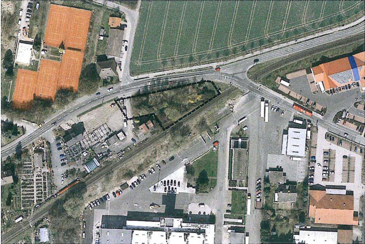
Abb. 1: Luftbild mit Geltungsbereich, Auszug aus dem Stadtatlas 2016

Das ca. 1.775 m 2 große Plangebiet befindet sich im Kasseler Stadtteil Nordshausen und liegt an der Korbacher Straße, nordöstlich des alten Bahnhofgeländes. Der Geltungsbereich umfasst die Flurstücke 64/5 (teilw.), 115/63 (teilw.), 135/64, 136/64 und 137/64 in der Flur 2, Gemarkung Oberzwehren.