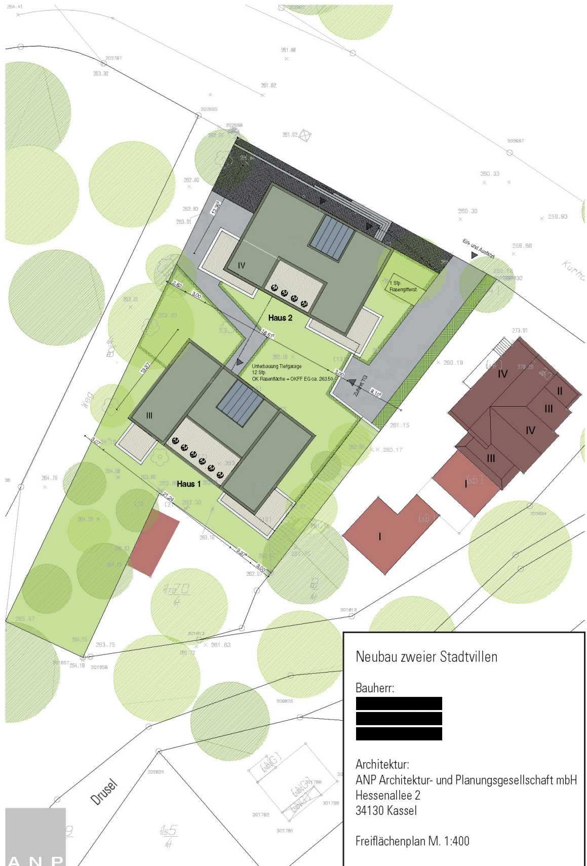
Abb.: Freiflächenplan (Verkleinerung o.M.), Vorentwurf Stand März 2010