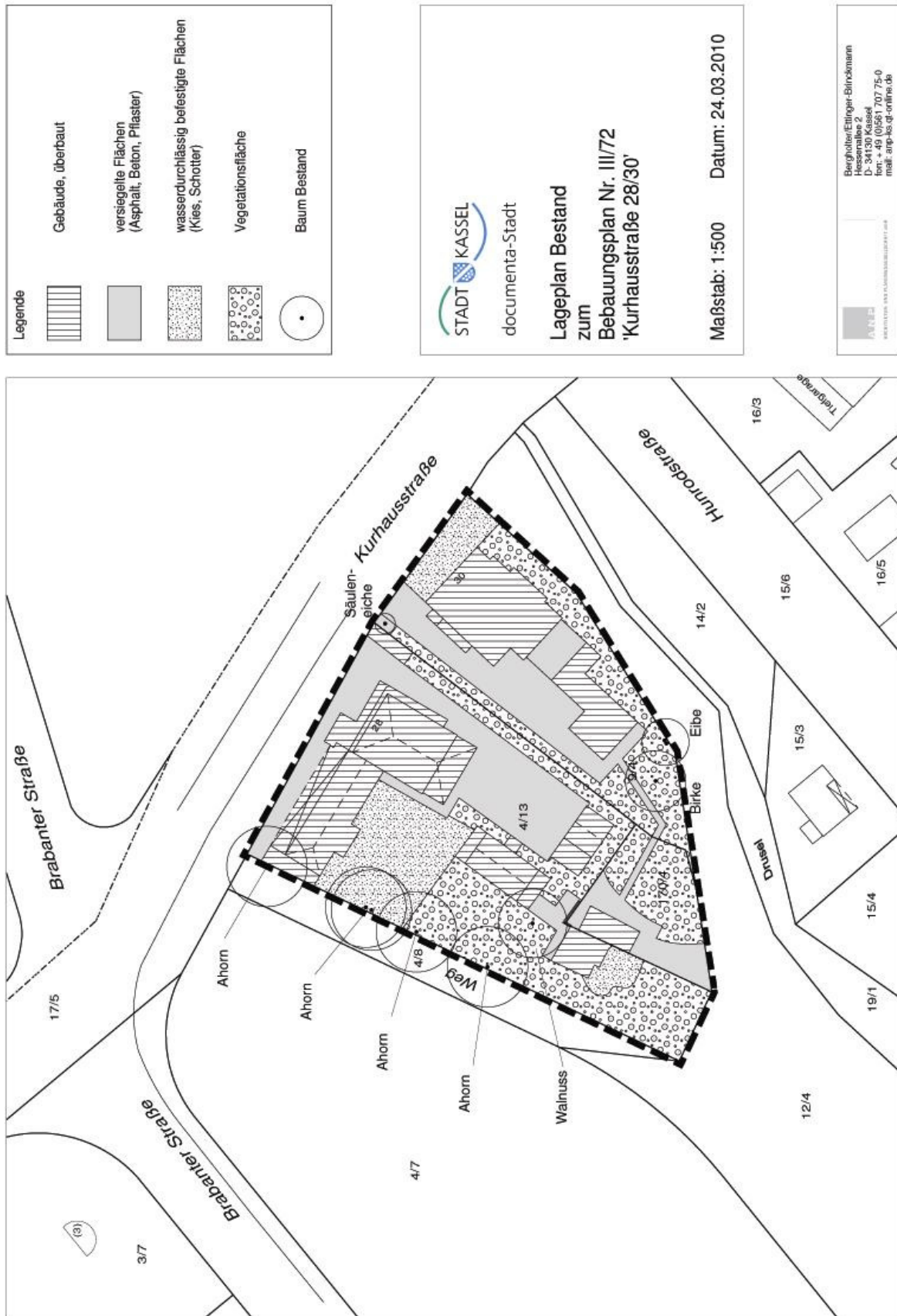
Abb.: Bestandsplan (Verkleinerung o.M.), März 2010, Quelle ANP