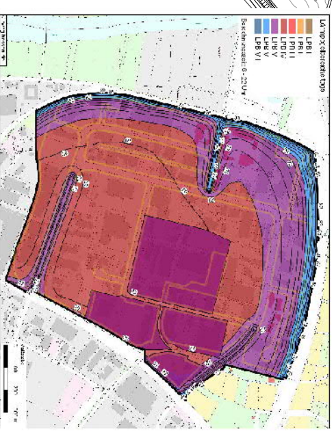
Nebenzeichnung 2: Lärmpegelbereiche tags sh. textliche Festsetzung 7.2.2