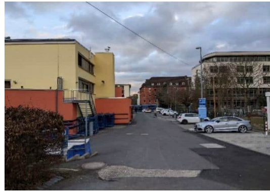
Rückwärtige Ansicht des Edeka-Marktes von Osten

Die Grundstücke wurden 2008 durch den Betreiber des EDEKA-Neukauf-Marktes Aschoff erworben mit dem Ziel, an dieser Stelle einen Lebensmittelvollsortimenter mit ca. 2.500 m 2 Verkaufsfläche einschließlich Metzgerei und Bäckerei zu errichten. Um einen städtebaulich und gestalterisch anspruchsvollen Markt zu gestalten, wurden bestehende Bauteile der damaligen Fabrikationshalle der Firma Polyma Energiesysteme GmbH erhalten und durch Neubauteile ergänzt. Unter anderem wurde das im Original erhaltene 1950er-Jahre Verwaltungsgebäude an der Frankfurter Straße zu einem Café und einer Bäckerei umgenutzt. Ein Teil des anschließenden Werkstattgebäudes wurde als Metzgerei über eine großzügige Mall in den Markt integriert. Eine 10 m hohe Fabrikationshalle wurde durch zwei Seitenschiffe von je 5,50 m Höhe zu einer ca. 2000 m 2 großen Markthalle mit einem besonderen mediterranen Flair gestaltet.