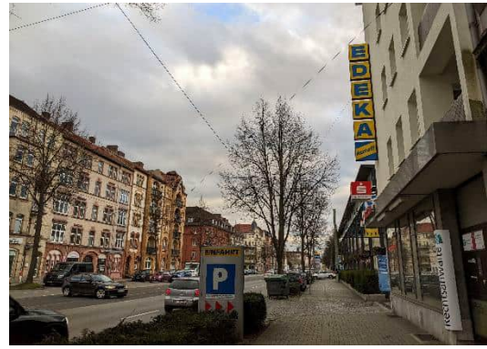
Blick auf den Edeka-Markt von Norden