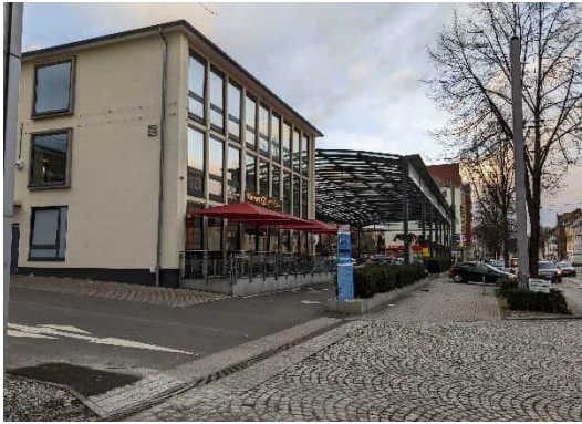
Blick auf den Edeka-Markt von Süden