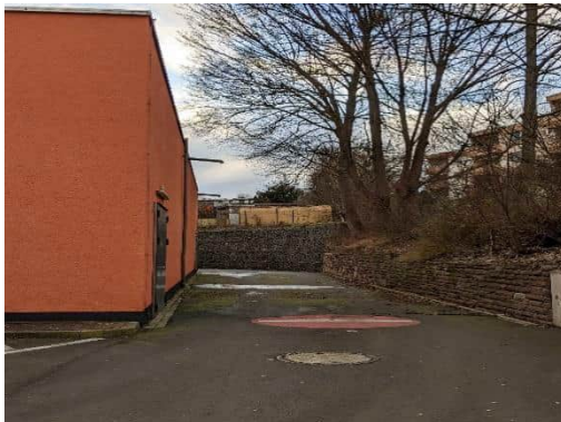
Ausfahrt der Anlieferungszone im westlichen Bereich