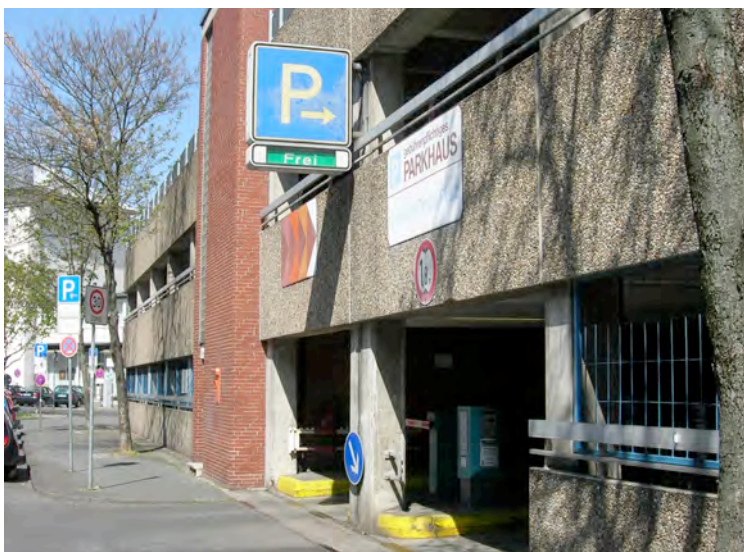
Parkhaus Friedrichstraße 9