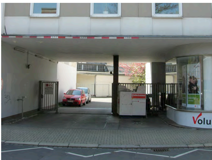
Durchfahrt Friedrichsstraße 14