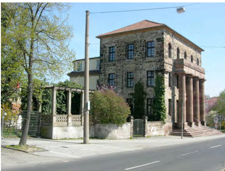
Torwache mit „Schnuddelplatz“