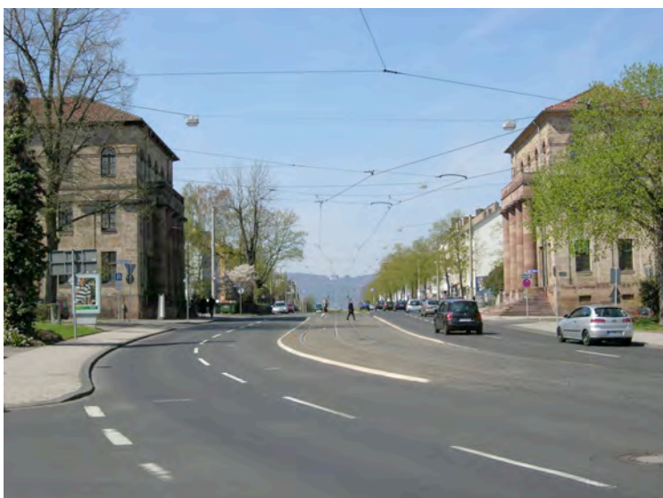
Wilhelmshöher Tor, Torwachen