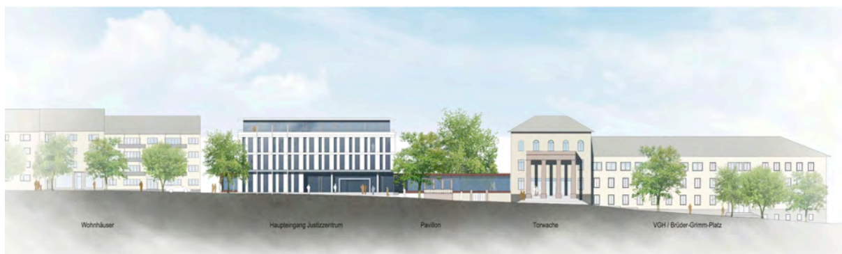
Ansicht Wilhelmshöher Allee