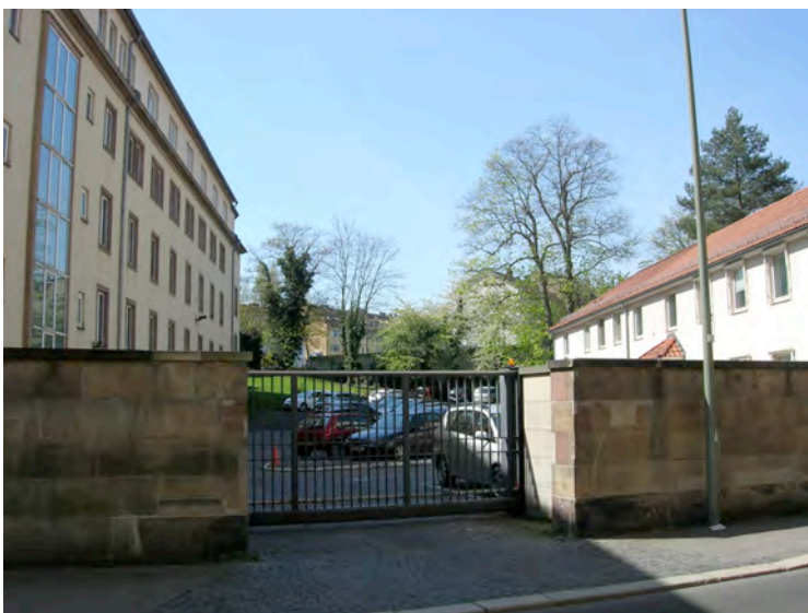
Verwaltungsgerichtshof, Zufahrt Friedrichsstraße 22