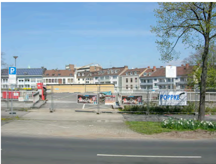
Wilhelmshöher Allee 2 und 4, inzwischen abgerissenes Parkdeck