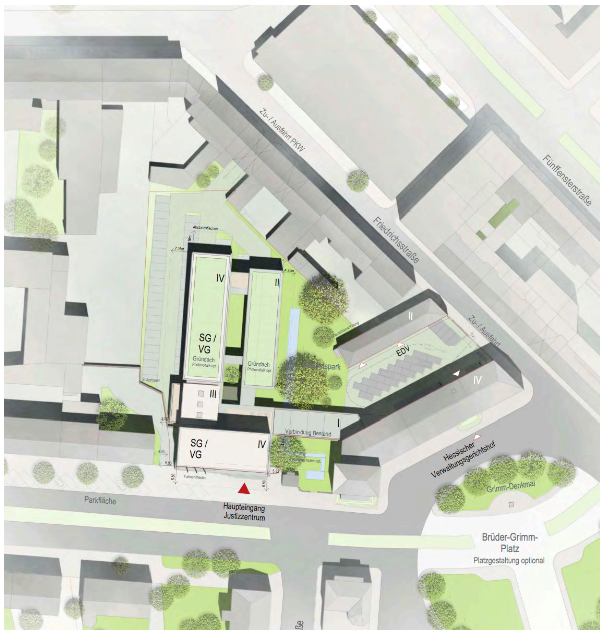
Justizzentrum 2, Lageplan