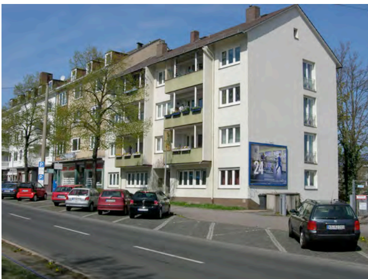
Wilhelmshöher Allee Nr. 6 und 8