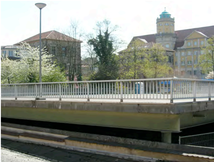
Ehemaliges Parkdeck Wilhelmshöher Allee 4, im Hintergrund Torwache und Landesmuseum