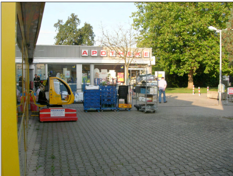
Apotheke, rechts hinten Platane