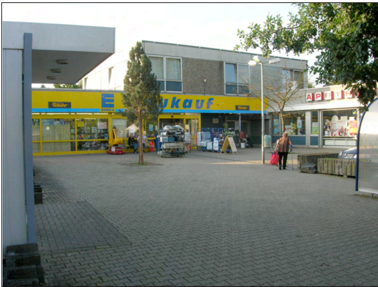
Hof- und Eingangsbereich, Zugang Lebensmittelmarkt, Obergeschoss mit Arztpraxen