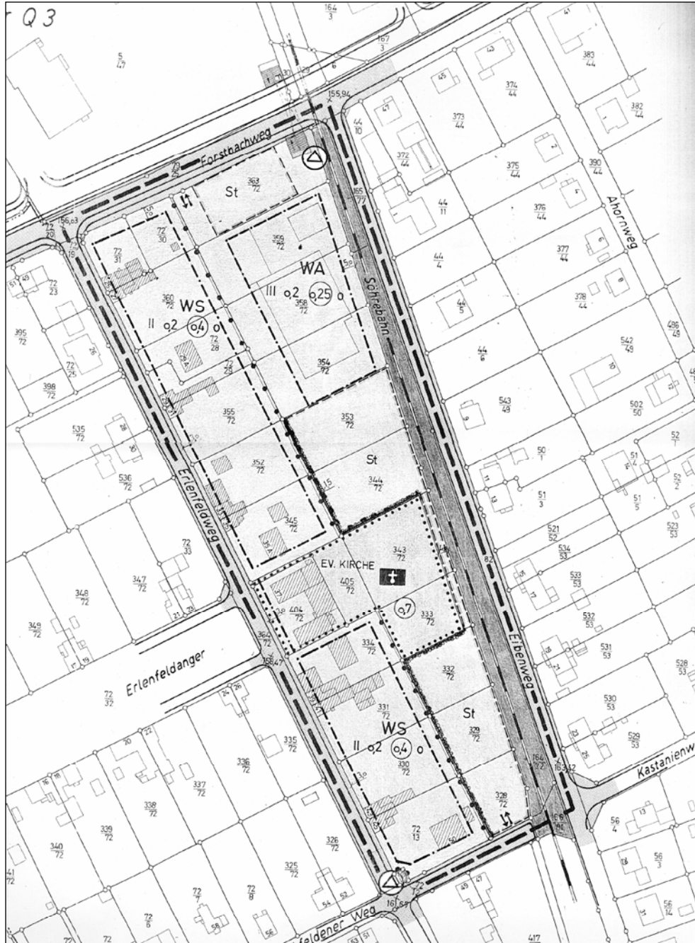
Bebauungsplan VII/29 (05.04.1975)