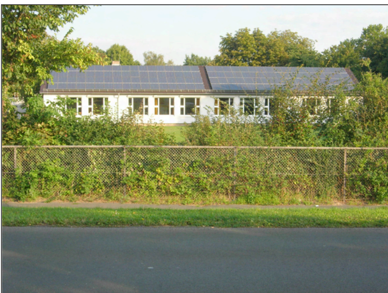
Schule nördlich des Forstbachweges