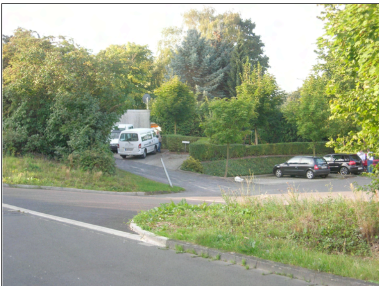
neue Ausfahrt auf den Eibenweg