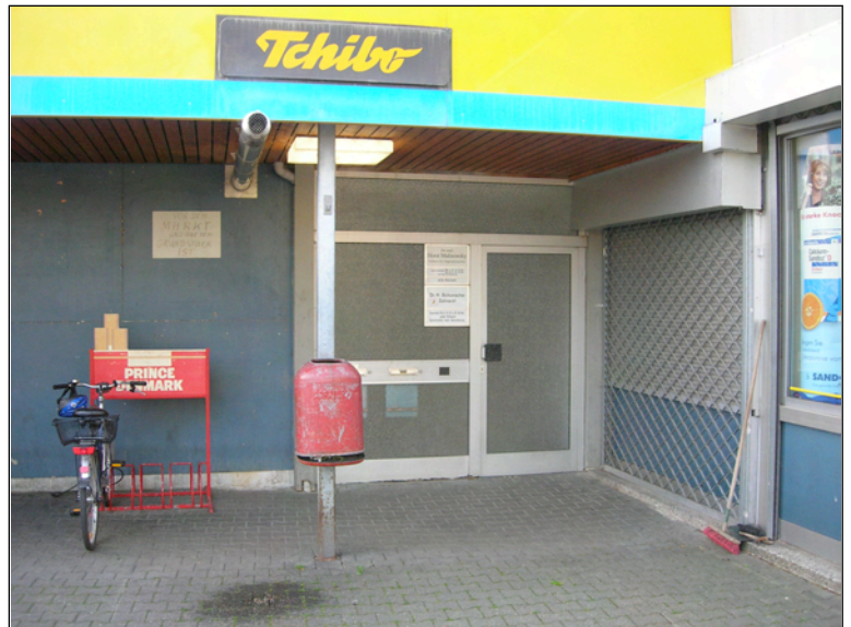
Lebensmittelmarkt Westfassade, rechts Thujahecke