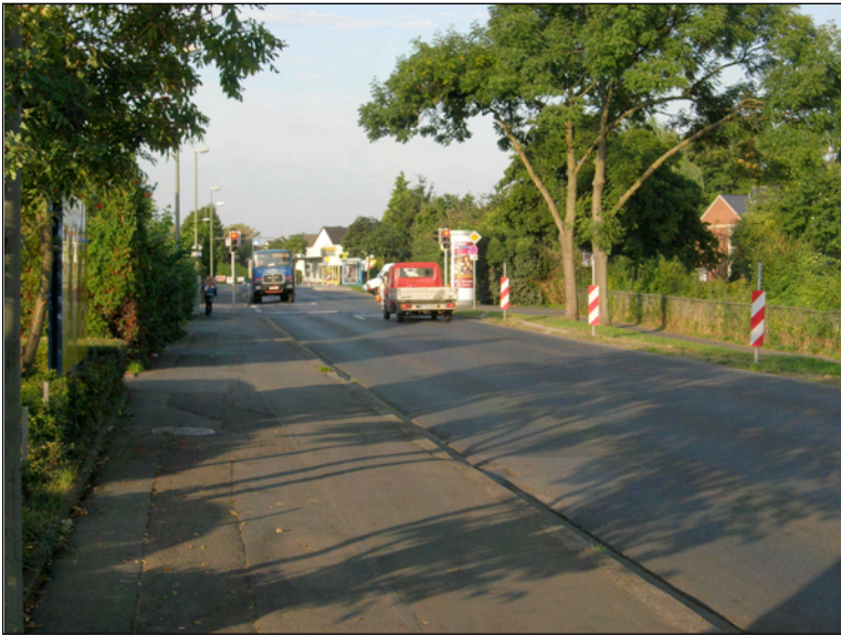
Forstbachweg, Blick Richtung Westen