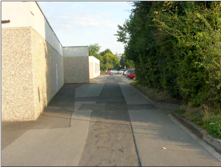
Durchfahrt, rechts Söhrebahntrasse