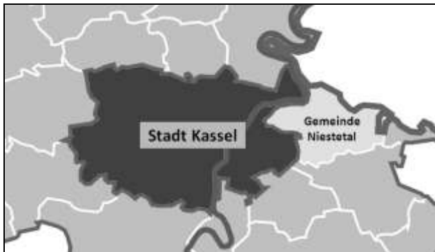
Abbildung 1: Geografische Lage der Gemeinde Niestetal

Nach Prüfung aller eingegangenen Angebote hat sich die Gemeinde Niestetal für das Kooperationsmodell der STW und NSG entschieden. Dieses Modell sieht den Aufbau einer Netzgesellschaft durch die NSG und der Gemeinde Niestetal bzw. einer gemeindeeigenen Beteiligungsgesellschaft (nachfolgend „Beteiligungsgesellschaft Niestetal“ genannt) vor – die Niestetal Netz GmbH (Arbeitstitel) .