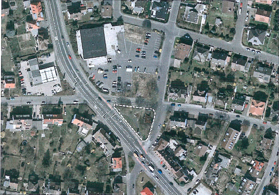
Abb. 1: Luftbild mit Geltungsbereich, Auszug aus dem Stadtatlas 2010

Der ca. 871 m 2 große Geltungsbereich des Plangebietes umfasst die Flurstücke 159/18 und 159/19 der Flur 2 in der Gemarkung Kirchditmold. Er schließt direkt an die Straßenparzelle 159/21 der Harleshäuser Straße an und wird nach Norden von der Christbuchenstraße (Wegeparzelle 20/36) und nach Osten vom Haardtweg (Wegeparzelle 77/16) begrenzt.