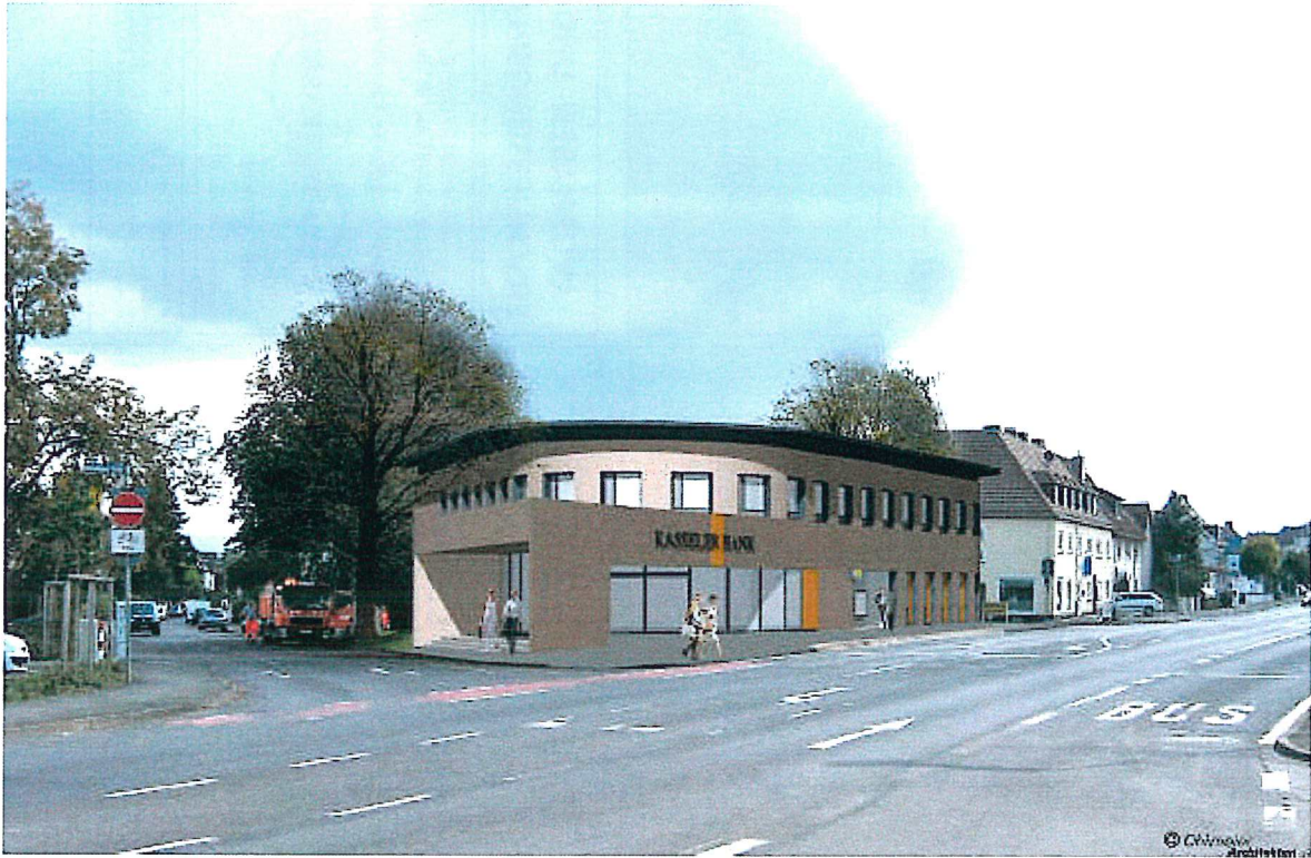
Ansicht Harleshäuser Straße / Christbuchenstraße