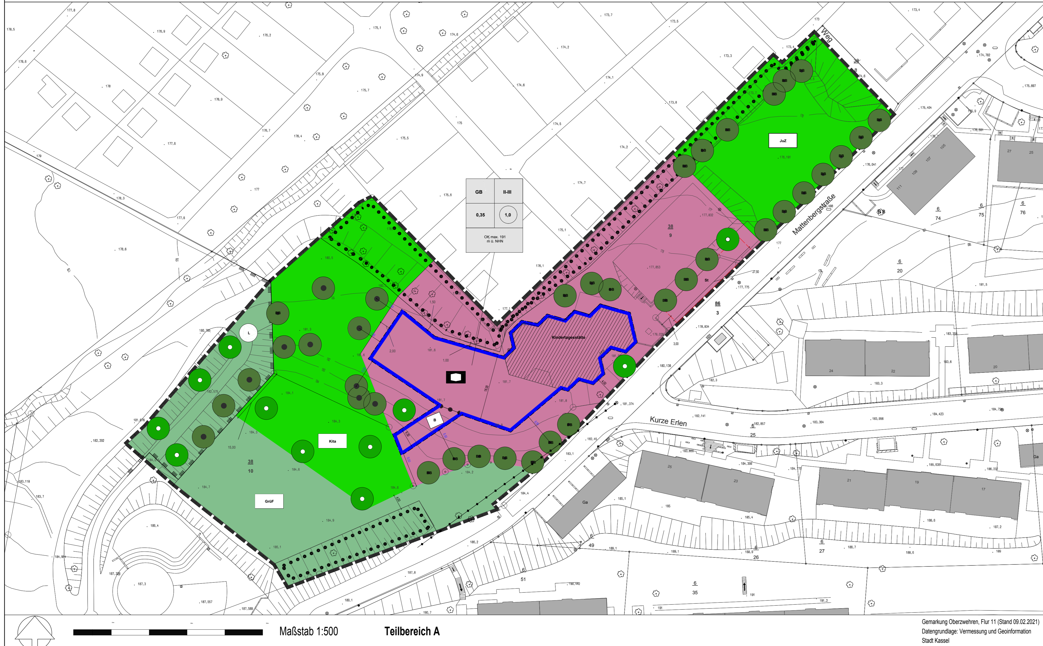
Maßstab 1:500 Teilbereich A Gemarkung Oberwehren, Flur 11 (Stand 09.02.2021) Datengrundlage: Vermessung und Geoinformation Stadt Kassel

BEBAUUNGSPLAN-ÄNDERUNG Mit dem Bebauungsplan Nr. VIII/29 „Kita Mattenbergstraße 168“ wird eine Teilfläche des Bebauungsplanes Nr. 9 SW/19 „Dauerkleingärten 19, Mattenberg“ vom 04. Februar 1985 geändert.