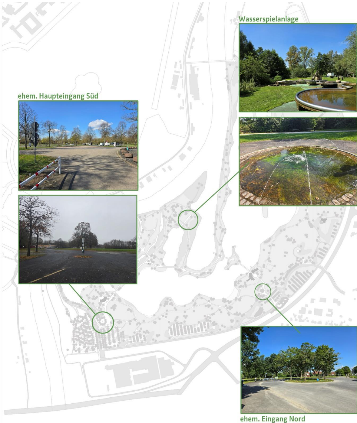
Verortung der drei Maßnahmen in der BUGA FULDAAE