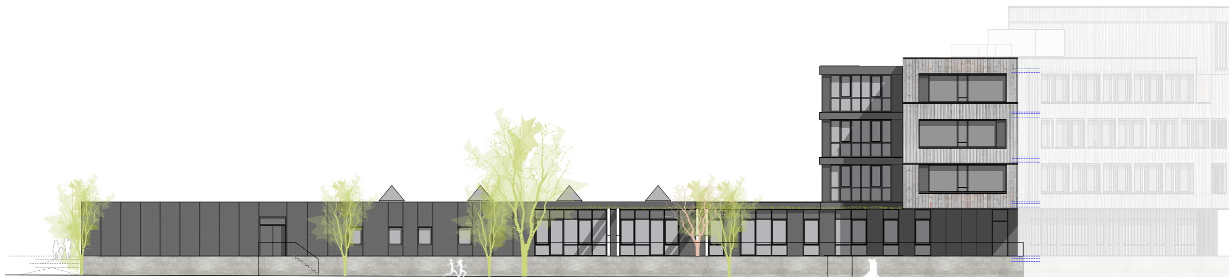
Ansicht Ost H.-v.-Fallerleben-Straße