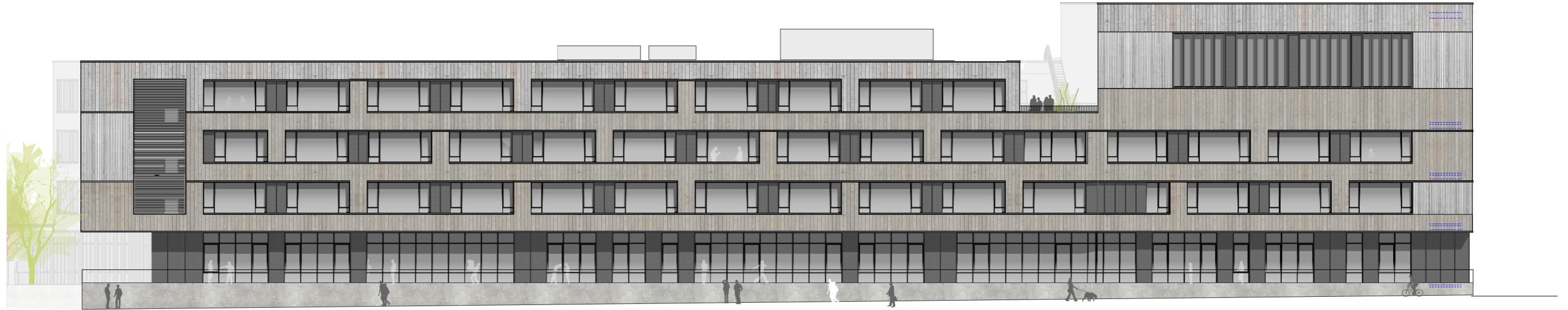
Ansicht Nord Wolfhager Straße