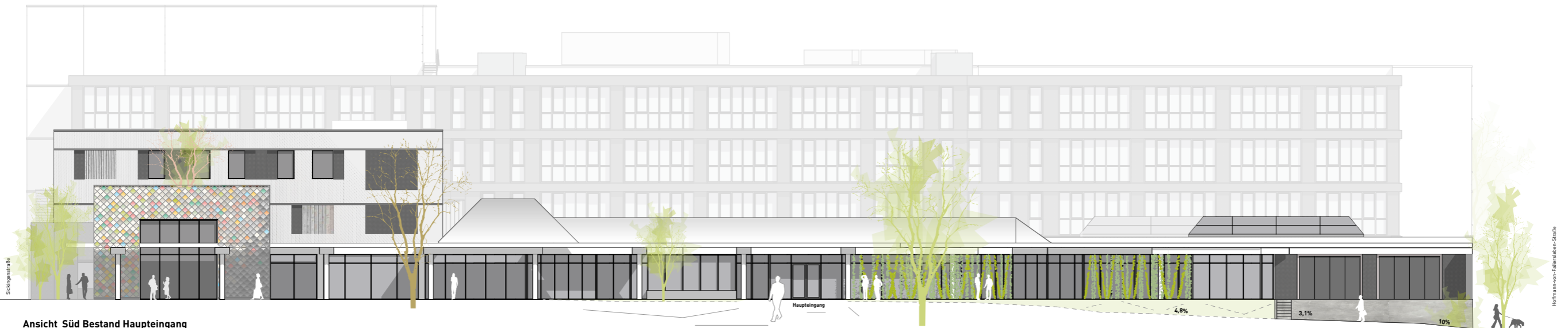
Ansicht Süd Bestand Haupteingang