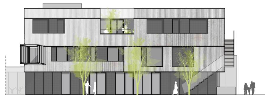
Ansicht Nord Bestand Aufstockung