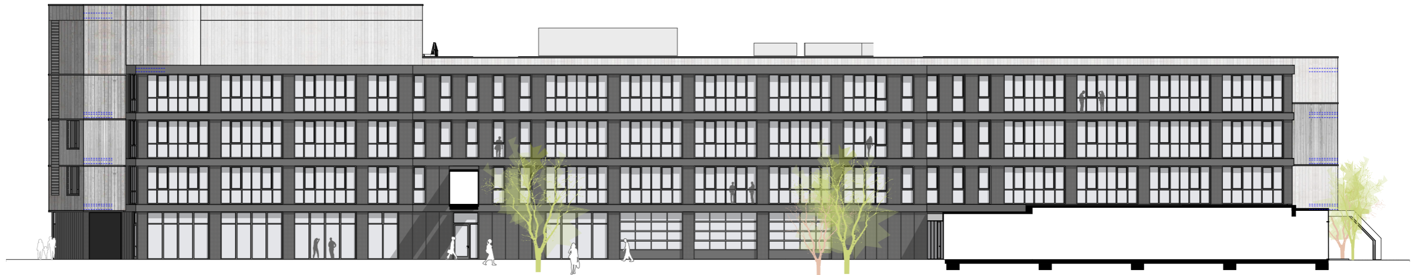
Ansicht Süd Werkhof