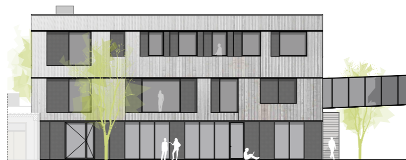
Ansicht Ost Bestand Aufstockung