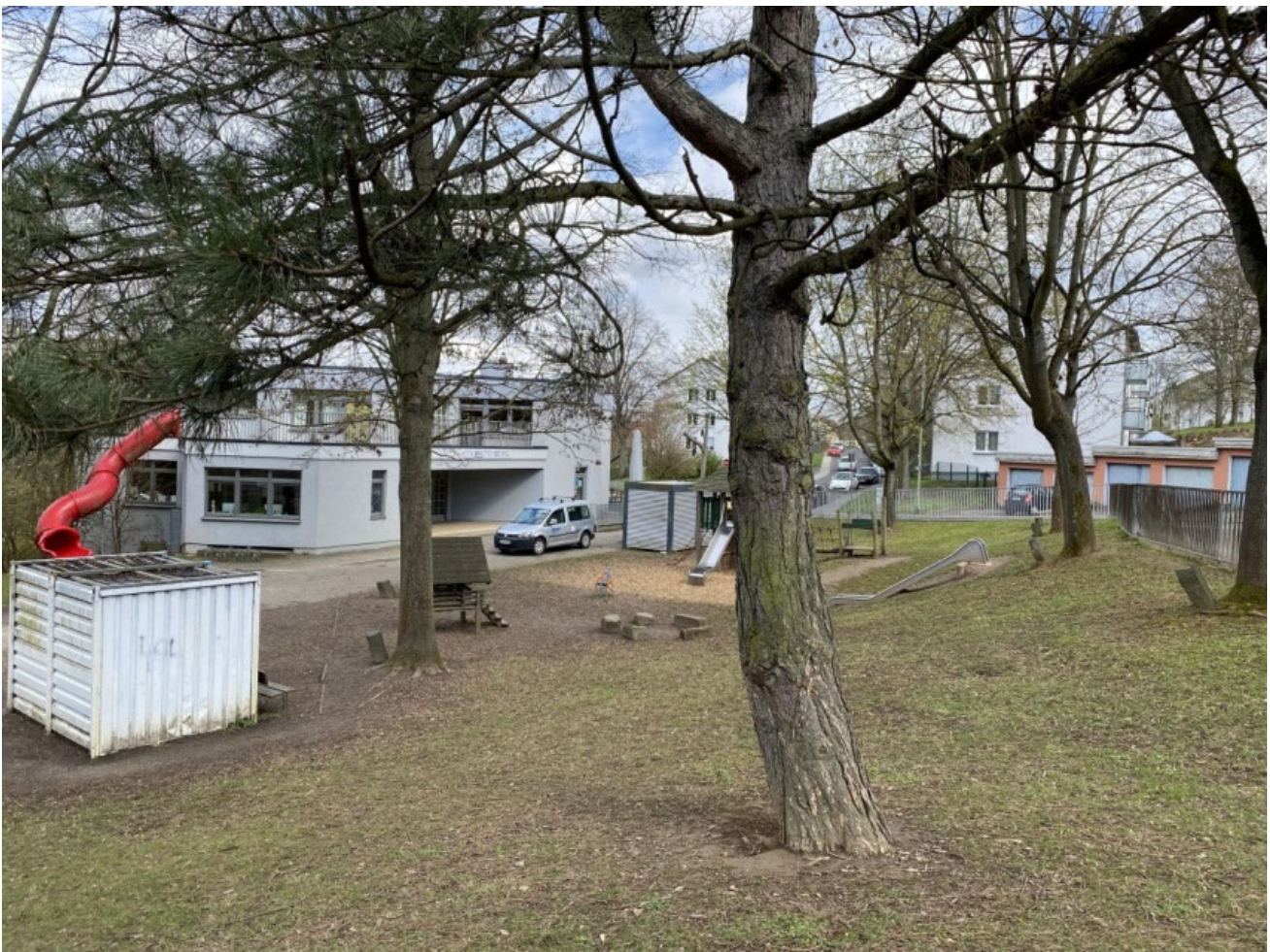
Die mit Basalt-Stelen markierten Bäume sind Bestandteil des stadträumlichen Skulptur 7000 Eichen im Geltungsbereich

Der Beirat 7000 Eichen wurde zu einem frühen Zeitpunkt der Planung in seiner Sitzung am 30. November 2021 und in einem ergänzenden Ortstermin am 16. Dezember 2021 zu den von der Planung berührten Standorten des Kunstwerkes beteiligt. Eine Beschlussfassung ist nicht erfolgt.