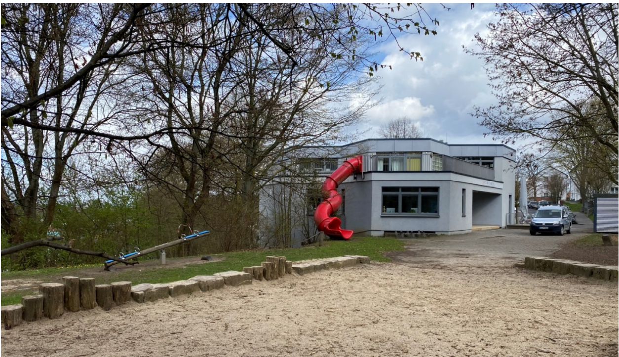
Südwestlicher Blick auf den geplanten Erweiterungsbereich und das bestehende Kita- und JuZ-Gebäude

In die Entscheidung, diese 4 Beuys-Bäume aufzugeben, ist neben den in der Standort-Wahl benannten wesentlichen baulichen Vorteilen dieses Standortes auch eingeflossen, dass der städtebauliche Charakter des Kunstwerkes 7000 Eichen durch die auf dem Kita-Grundstück gesicherten 27 weiteren Beuys-Bäume in hohem Maß erhalten bleibt. Insbesondere die prägende Baumreihe entlang der Mattenbergstraße kann durch die Baufeld-Anpassungen vollständig gesichert werden. Zusätzlich werden im Bebauungsplan auf dem Kita-Grundstück insgesamt 7 neue Baumstandorte festgesetzt – darunter 2 entlang der Mattenbergstraße und 5 in räumlicher Nachbarschaft zu den aufgegebenen 4 Beuys-Bäumen – die dem Beirat 7000 Eichen als mögliche Nachfolgestandorte am Ort des Eingriffs zur Verfügung stehen.