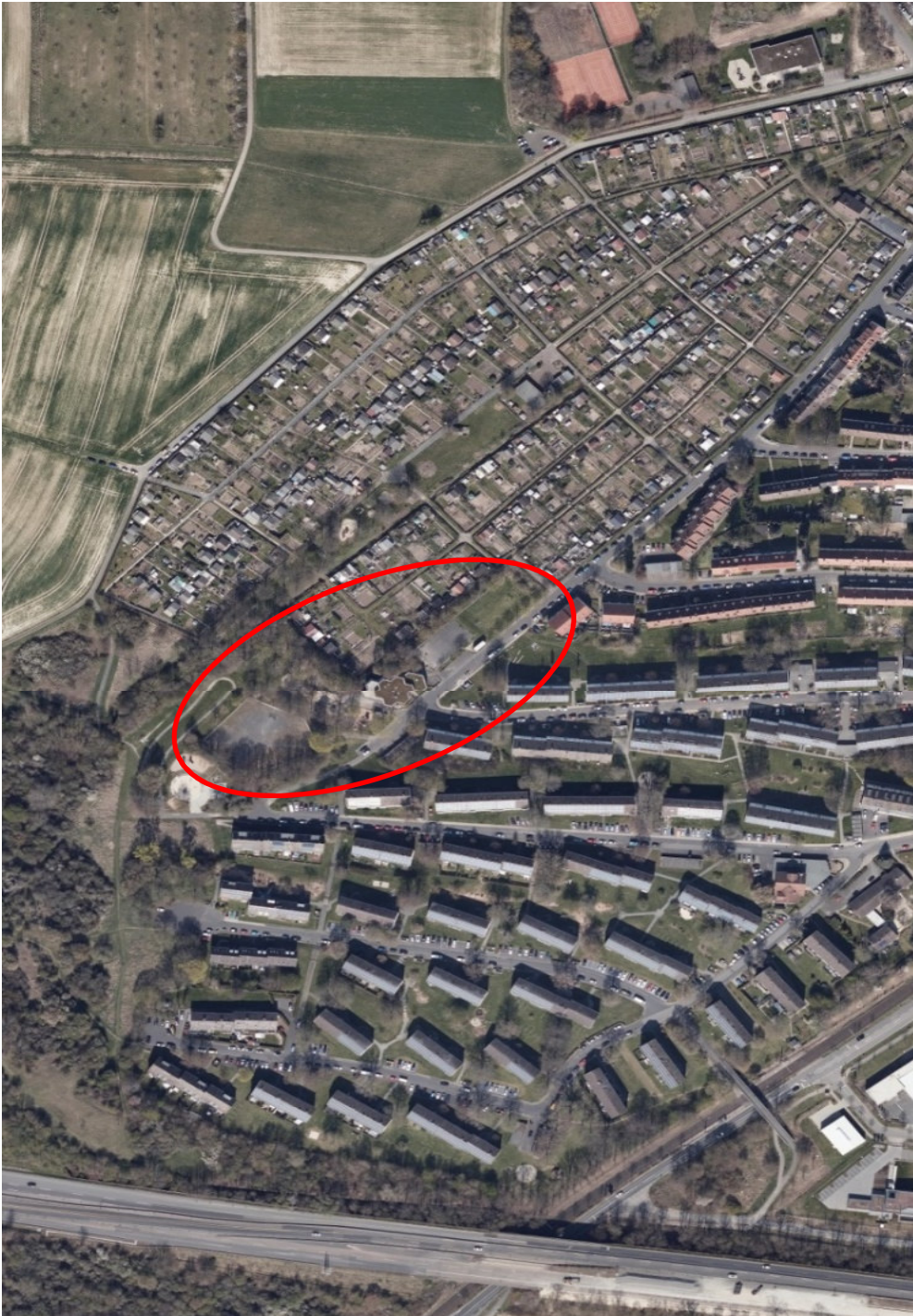
Luftbild stadträumliches Umfeld Kita Mattenbergstraße 168