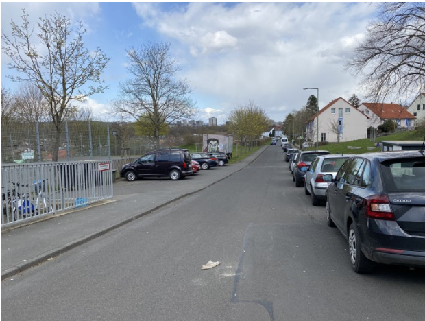
Blick Richtung Nordosten auf die Mattenbergstraße mit ruhendem Verkehr